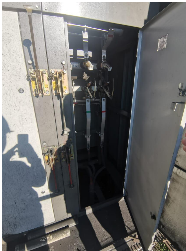
ТП 2153/1 прис. 6 кВ ввод № 2

В 12:35 производитель работ и электромонтёр 1 прибыли на ТП-2153/1-6/0,4 кВ. Электромонтёр 1 начал производить отключение рубильников в ТП-2153/1, после чего приступил к проверке отсутствия напряжения в ячейках ТП-2153/1 указателем высокого напряжения УВНУ-10 СЗ, после чего ячейки были закрыты. Бригада в это время находилась внизу возле ТП-2153/1