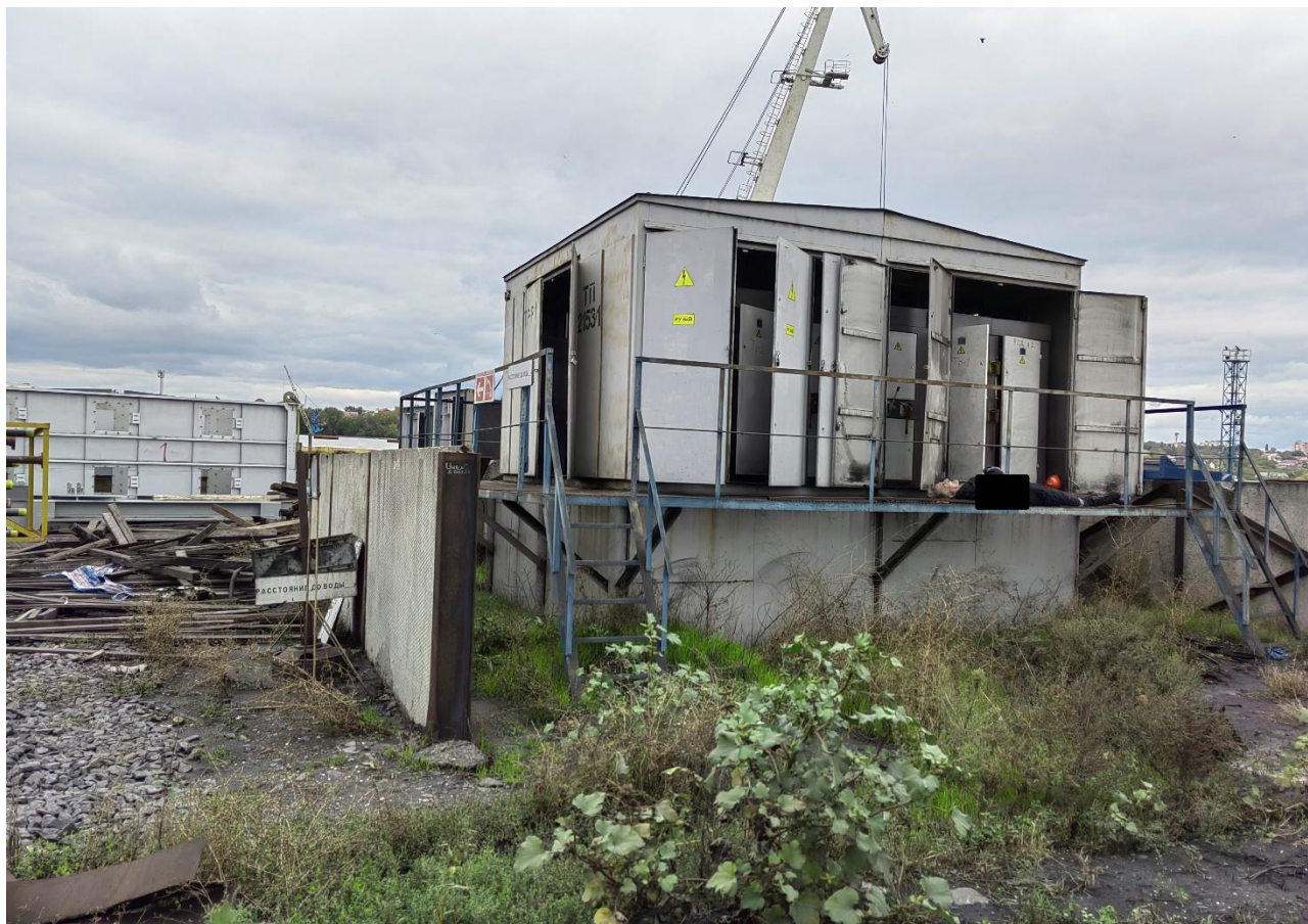
ТП 2153/1-6/0,4 кВ

В 08:30 главный энергетик выдал наряд-допуск производителю работ инженеру-энергетику (далее – производитель работ), проинструктировав его о месте проведения работ и необходимых мерах безопасности.